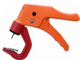
OS ID Combi Matic

En gammal och rostig tång kan vara svår att klämma eller göra ett högt ljud som kan skrämja djuren. Nya, lätta, ergonomiska tänger är bekvämare, både för djuret och för den som märker. Till våra OS ID Combi 3000 öronmärken finns det 3 tänger som fungerar. Alla våra tänger skall ha svart nål.