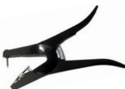
OS ID Combi Junior