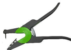
OS ID Combi Junior Green