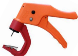
OS ID Combi Matic

En gammal och rostig tång kan vara svår att klämma eller göra ett högt ljud som kan skrämja djuren. Nya, lätta, ergonomiska tänger är bekvämare, både för djuret och för den som märker. Till våra OS ID Combi 3000 öronmärken finns det 3 tänger som fungerar. Alla våra tänger skall ha svart nål.