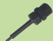
Junior nål, 20 mm

Sårytan läker snabbt och den stängda märkesspetsen förhindrar bakterietillväxt. Man hör ett tydligt klick vid i sättningen när märket sitter i lås.