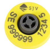
Combi E30 Rund Ø 28,5 mm