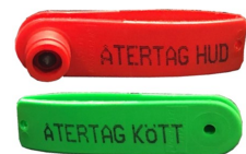
Combi Signal märke

Vi har två öronmärken som lämpar sig som återtagsmärken, Combi Signal (se bild) och Micro öronmärke. Innan beställning av återtagsmärken hör av dig till ditt slakteri om vilken prägling som behövs på märket. Kunder som skickar sina djur till Scan beställer återtagsmärken via Scan. KLS Ugglarps önskar medlemsnummer. För mer info om våra återtagsmärken och för frågor kring prägling kontakta oss eller besök vår hemsida.