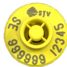
E23 öronmärke för får

Från 1 september till och med 1 november har vi vår årliga kampanj av det elektroniska öronmärket E23 för 14,50 kr/st. Kampanjen gäller både vid nybeställning av originalmärken samt kompletterande beställning av ersättningsmärken till befintliga djur. Ingen kampanjkod eller föransökan behövs och priset gäller oavsett antal märken. Det enda du behöver tänka på är att beställa dina öronmärken inom den angivna kampanjperioden. Besök vår hemsida eller ring oss så berättar vi mer om fördelarna med elektroniska öronmärken.