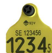
57 mm x 59,2 mm

Medium märken kan väljas i kombination Stor + Medium eller som par, Medium + Medium. Eller valfritt E30/TST + Medium.