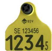
57 mm x 59,2 mm

Medium märken kan väljas i kombination Stor + Medium eller som par, Medium + Medium. Eller valfritt E30/TST + Medium.