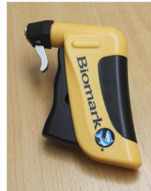
Förhandsladdade nålar på bricka à 100 styck. MK-25, liten och behändig pistol för implantering