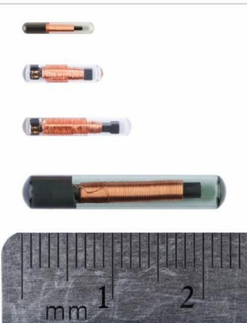
Pit-tags av hög kvalitet.