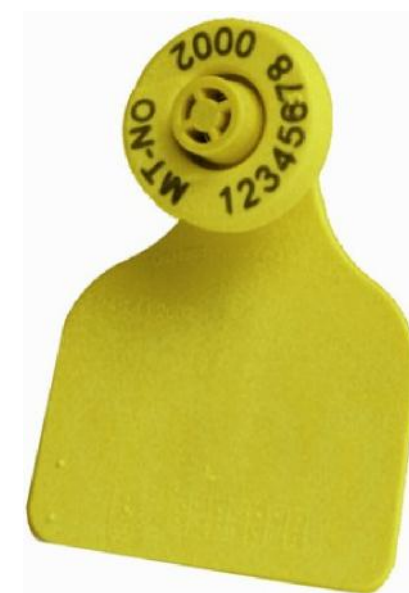
Combi E30 ® med handel Combi 2000 ® Stor

CombiE ® skall sättas fast med Combi Junior tång. Både fastsättningen och användandet är djurvänlig. Sårytan läker snabbt och en stängd märkespets förhindrar smittoöverföring.